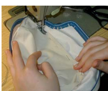
Puld og klapper samles