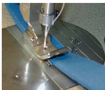
Paspel syes med snor i fold.