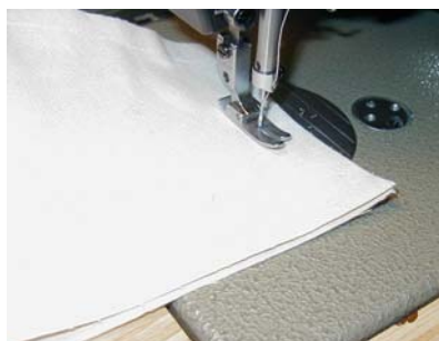
Puld sidestykker syes og samles med topstykke.