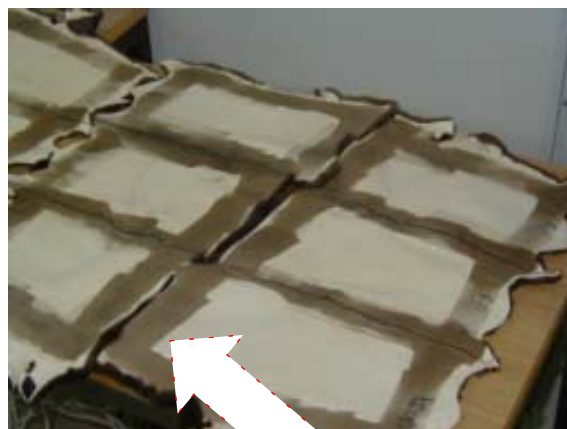
Midt bag søm

-omrystes godt i et glas, hvorefter man lige laver en lillefarve prøve og justerer efter ønske. ..Penslingen kan begynde under gode udluftnings forhold!!